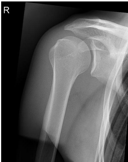
Afbeelding 1: Gezond rechter schoudergewricht dat vanwege het gezonde kraakbeen en goede pasvorm een goede (glij)functie heeft.

Rondom het schoudergewricht zitten verschillende spieren en pezen die belangrijk zijn bij de bewegingen in alle richtingen. De rotatorenmanchet (spieren die belangrijk zijn voor de draaibewegingen en de stabiliteit in de schouder) bestaat uit 4 spieren. Daaroverheen ligt de deltoïdspier, die ook belangrijk is voor de bewegingen van de schouder.