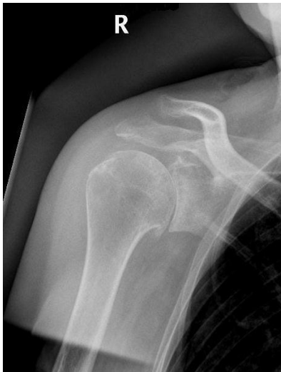
Afbeelding 2: Het kraakbeen tussen de schouderkop en de schouderkom is deels aangetast door slijtage. Hierdoor kunnen de gewrichtsvlakken niet soepel langs elkaar glijden

Niet alleen door gewrichtsslijtage kan de schouder ernstig worden aangetast. Ook een gewrichtsontsteking of een ongeval kunnen leiden tot beschadigingen van het gewricht. Ook kraakbeen- en stofwisselingsziekten kunnen een bijdrage leveren aan verslechtering van het schoudergewricht.