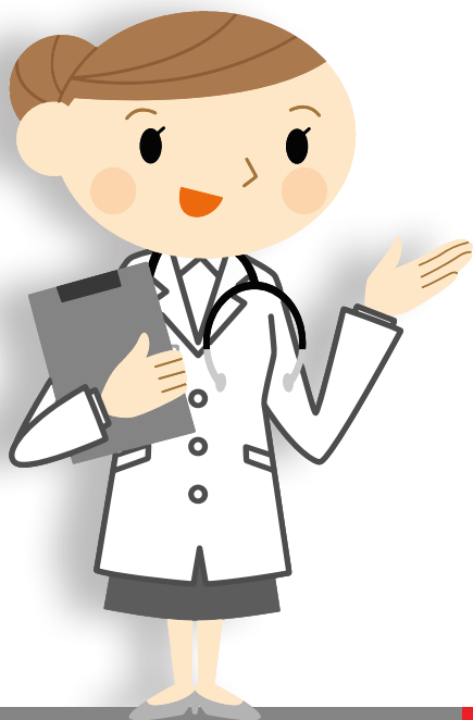
Huisarts / Specialist