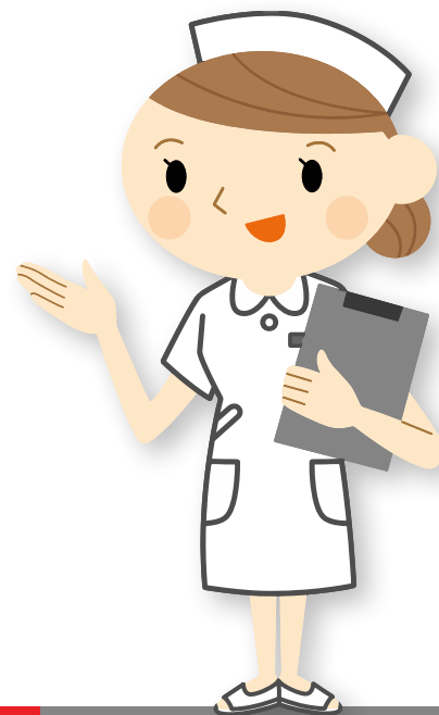
Verpleegkundige / Huisartsassistent