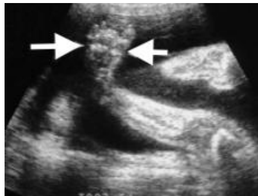
Figuur 1 Klompvoet bij 20 weken echo

Een klompvoet komt bij ongeveer 1 op de 1000 kinderen voor. Meestal wordt deze tijdens de zwangerschap (bij de 20 weken echo) ontdekt of bij de geboorte geconstateerd. Per jaar worden er in Nederland ongeveer 200 kinderen geboren met één of twee klompvoeten. Bij 75% van de gevallen is het een aandoening die bij jongens voorkomt. Soms gebeurt het dat een ander familielid ook een klompvoet heeft; in dat geval lijkt de klompvoet erfelijk te kunnen zijn. In 40% van de gevallen zijn beide voeten aangedaan.