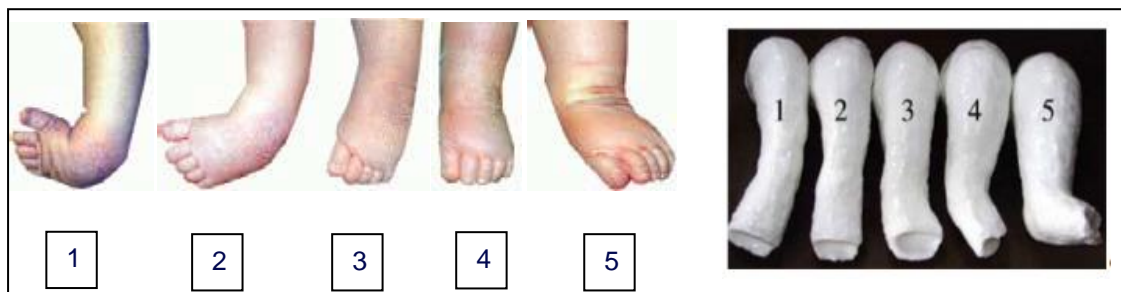
Figuur 2 Geleidelijke verandering van de standen

In het Reinier de Graaf gasthuiswerken we volgens de Ponseti methode. Deze methode is gebaseerd op een standsverbetering door geleidelijke correctie van de stand van de voet in gips gedurende de eerste weken na de geboorte. Dit gips loopt van de voet tot bijna aan de lies met de knie gebogen.