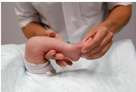
Figuur 3 Controle door de arts

Vervolgens komt de orthopeed op de gipskamer om de voortgang te controleren.