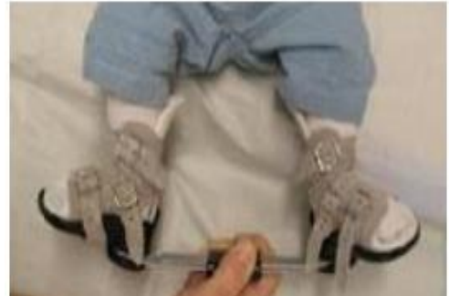
Figuur 5 De brace: schoentjes met beugel

Als het gips eraf is wordt de brace aangelegd. Deze brace bestaat uit twee speciale schoentjes en een beugel. Beide schoentjes kunnen worden vastgezet op een metalen beugel. Dit is ook het geval als uw kind maar één klompvoet heeft. Samen met de gipsverbandmeester en de arts worden de schoenen voor het eerst aangedaan en krijgt u uitleg hoe u dit thuis moet doen. Thuis moet u erop letten of de schoenen goed zitten en of er geen blaren of wondjes ontstaan.