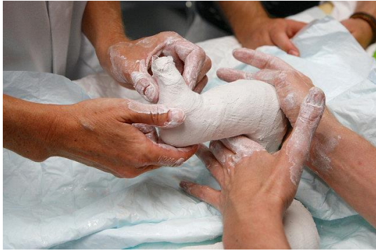
Figuur 4 Nieuw gips